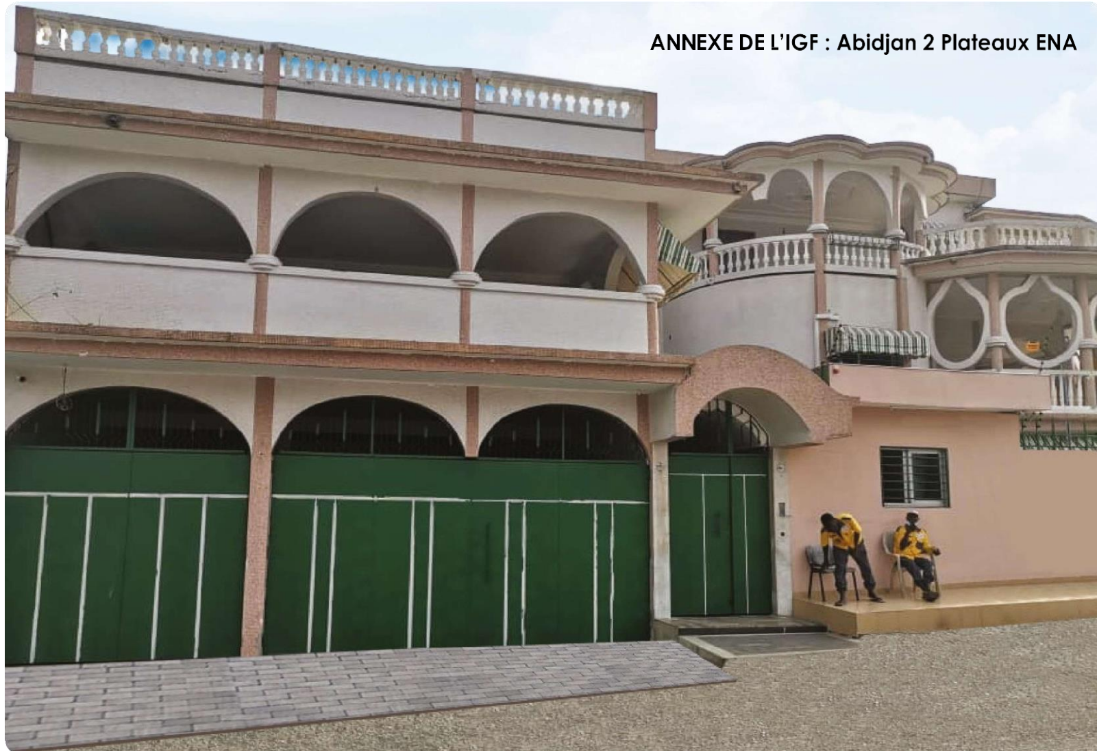
ANNEXE DE L'IGF : Abidjan 2 Plateaux ENA