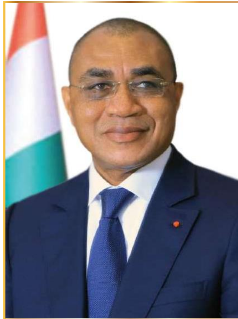
Adama COULIBALY Ministre de l'Économie et des Finances