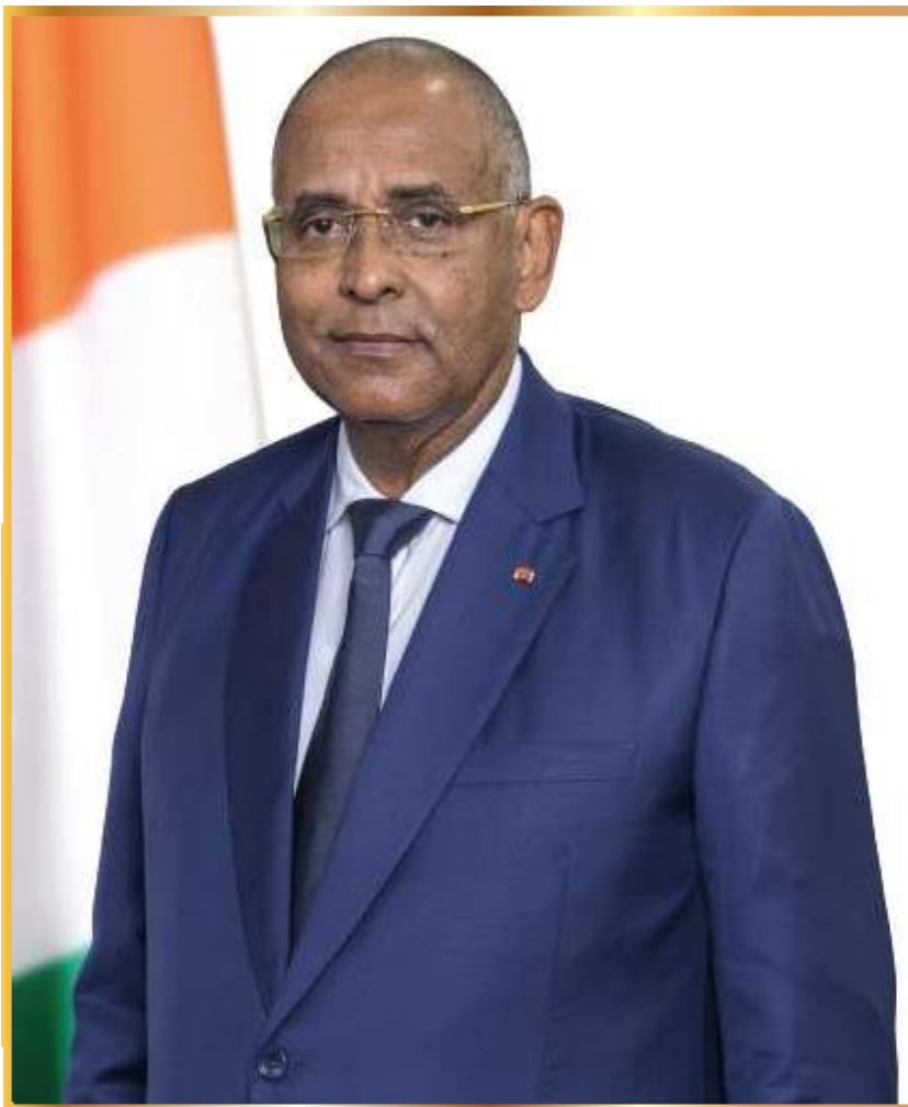
Patrick ACHI Premier Ministre Chef du Gouvernement